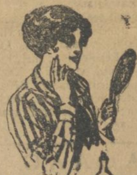
Obat koekoel dan tal'aler jang moestadjae dari Sio Tjoe Yok Pang

Obat aer bedak elioek Francis - Paris atau koekoel dan tal'aler per Flesch bedak pararas elioek f 1.— per dozijn . . . . f 10.—